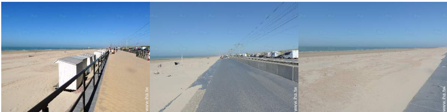
附近的海边活动项目